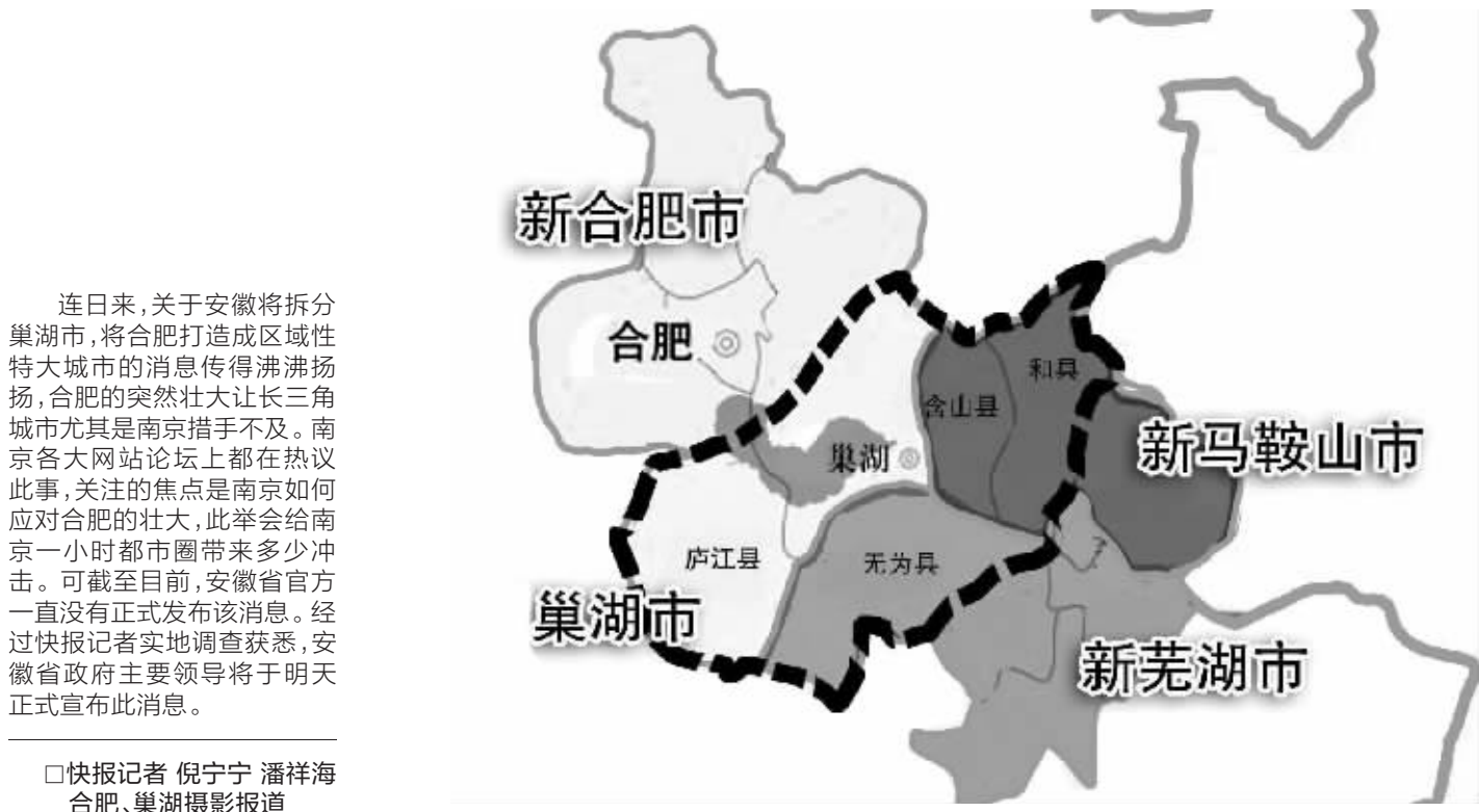
巢湖市将一分为三 制图 俞晓翔

■快报调查获悉,安徽省政府或将于近日公布分拆方案 ■分拆后,巢湖将成为合肥内湖,如此廓张引来价值争议