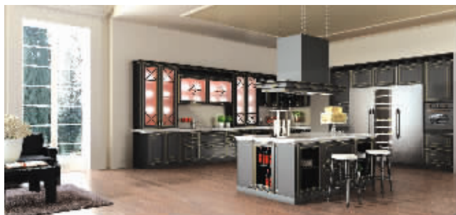
博洛尼橱柜普罗旺斯系列

8月21日,由博洛尼整体家居主办,TESIRO通灵、JAGUAR汽车特别赞助的2011博洛尼“品味生活”主题休闲沙龙暨首届家·生活奢侈品鉴赏会在典雅居大厦博洛尼家居体验馆举办。届时,懂生活的你不但可以在现场领略博洛尼整体厨房最新研发的7×16种最舒服厨房姿势,还可以品鉴珠宝、名车。