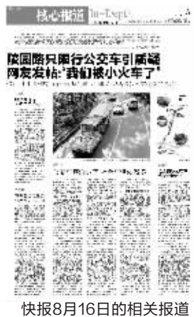
快报8月16日的相关报道

该人士建议,观光车应该重新设计更合理的观光线路,将景区内的各大景点串联起来,并推出通票制,游客可以多次上下车,只要买一张票,就能解决多个景点之间的交通问题。这是观光车的优势所在,也是公交车无法做到的。