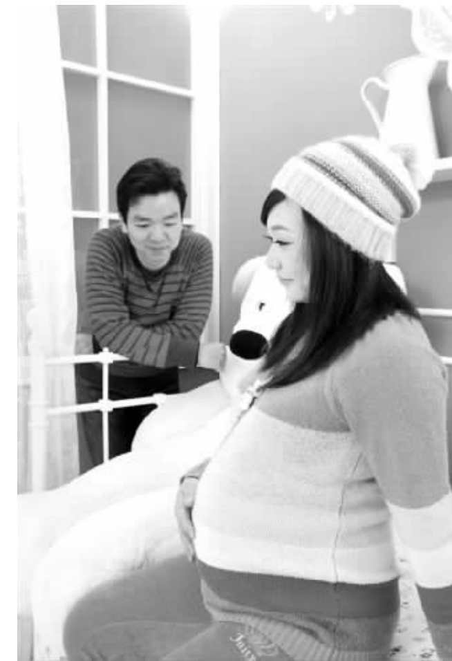
2167号李墨涵爸爸妈妈

会消失,这是正常现象。但如果感觉乳头疼痛始终不退,逐渐加重,说明乳头上可能有裂口。出现乳头皲裂大都是因为婴儿含接姿势不当造成的,婴儿没有含接住大部分乳晕,易出现乳头皲裂。有的母亲因受不了疼痛而放弃母乳喂养,一旦有细菌侵入就容易引起感染,甚至引发乳腺炎的可能,非常可惜。