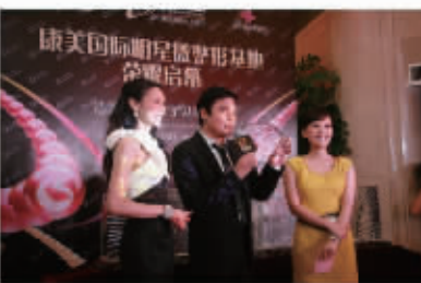
罗嘉良、郭可盈共同见证康美国际明星微整形基地的启幕