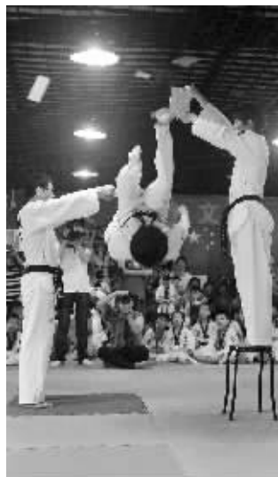
选手们在切磋武艺