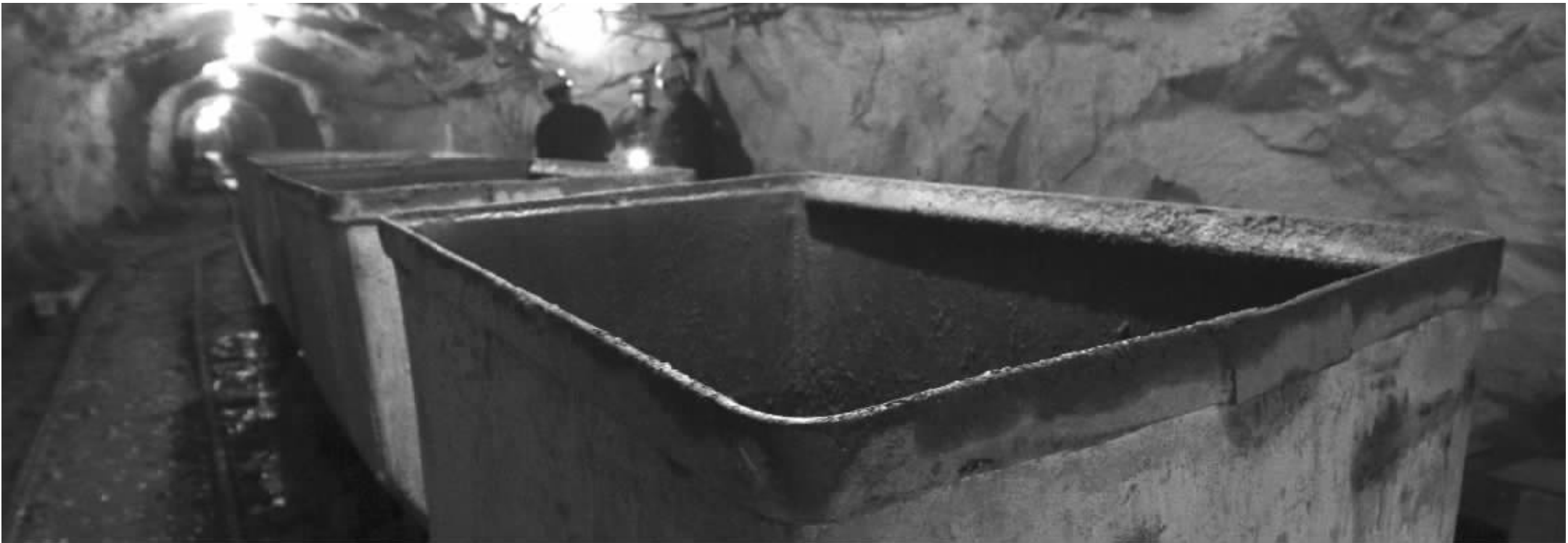
电影《盲井》让公众了解到原来在漆黑的矿井下，不仅有辛勤采煤的工人，还发生过令人发指的杀人暴行