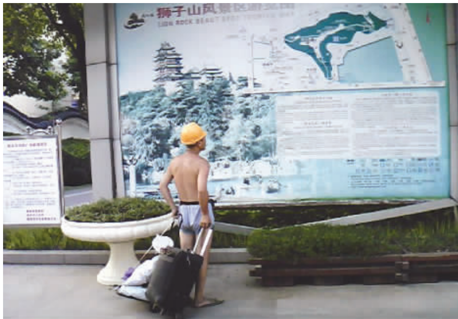
在南京那么久,好多景区还没去过,临走前,得去瞧瞧。8月9日摄于狮子山 (作者黄亮获30元话费)