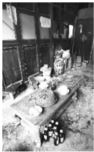
河房成了厨房