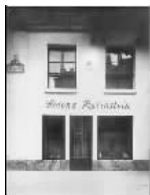
赫莲娜夫人创立世界上第一家美容院

1902年,赫莲娜夫人在墨尔本开设了全球第一家专业美容院,并由此衍生出一种崭新的职业:美容师。自此,资深美容师和专业按摩手法成为赫莲娜引以为傲的美容房特色!我们的资深美容师会根据每一位客人的肤质,肌肤状况和生活习惯度身定制专属护理方案。从肩颈按摩,到精华液精准导入,通过独特按摩手法将全套HR赫莲娜经典产品的珍