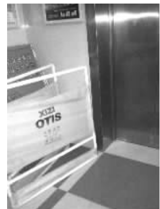
正在维修的另一部电梯