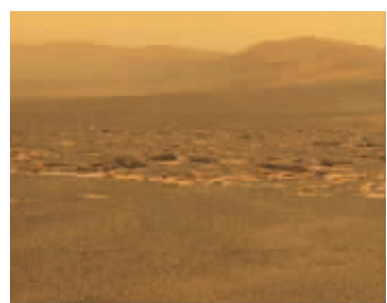
奋进号陨坑西侧边缘