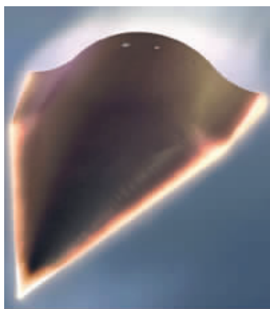
艺术家所描绘的猎鹰HTV-2