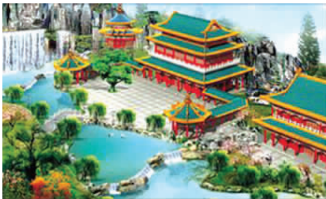
“中国愿景”主题公园设计图

据悉,“中国愿景”的开发商是一个国际财团,其中包括一家英国开发商、一名英国“奥尔顿塔”主题乐园(全球10大游乐园之一)前老板以及数家来自中国的投资商。“中国愿景”项目占地面积达120英亩,毗邻罗瑟