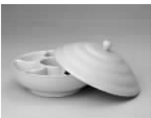
清乾隆·淡黄釉盖盒