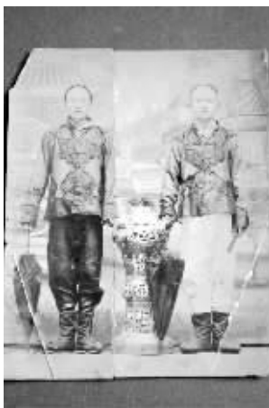
太平天国水兵造型的照片