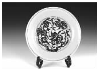
清乾隆·黄釉青花九桃纹盘