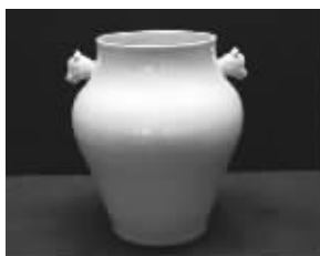
清道光·黄釉兽耳尊