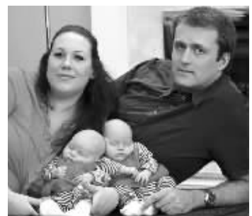
瑞切尔夫妇以及他们的双胞胎女儿