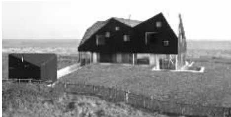
萨福克郡的“沙丘别墅”

哲学家、畅销书作者阿兰·德波顿希望能改善英国人的生活,让他们试着去欣赏现代建筑。他希望借由一系列由顶级建筑师设计的未来风格度假别墅,来改变英国社会。