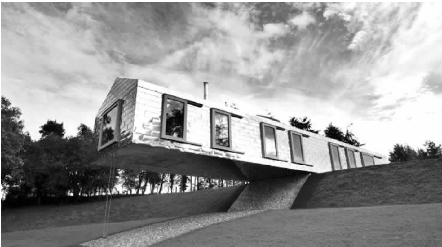
萨福克郡的“平衡舱”