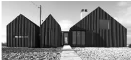
肯特郡一处海滩上的“木瓦楼”