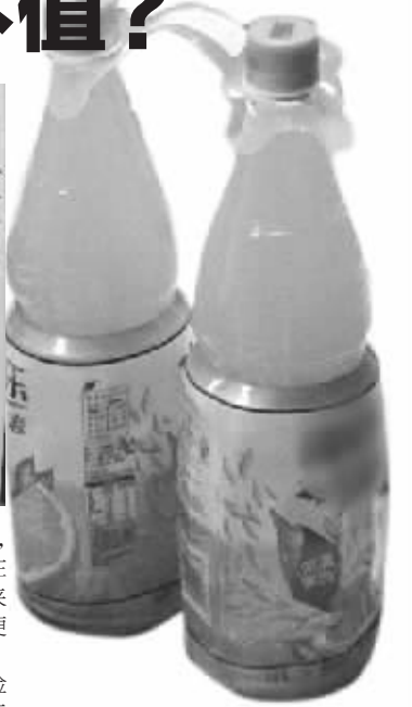
为啥不能送“清凉”上门

南京市企业职工养老保险结算管理中心一位工作人员表示,这次活动他们并没有硬性安排,由各个社区具体操作,时间从8月1日到9月30日,“只要在在规定时间内发放到即可。”