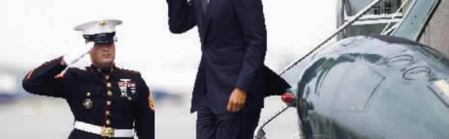
8月9日,美国总统奥巴马抵达特拉华州多佛空军基地

8月9日,美国总统奥巴马突然改变行程,亲自率军政要员前往特拉华州的多佛空军基地,向30名在阿富汗阵亡的美军士兵遗体致礼,并向他们的家属和现役军人表示慰问。与以往不同的是,此次遗体转交是在十分低调和保密的情况下进行的,五角大楼有话在先,由于情况特殊,不邀请媒体进行报道,甚至同奥巴马前往多佛的记者也约法三章,只有等总统座机降落后才能报道奥巴马私下悼念阵亡士兵的消息。此次遗体回国交接仪式为何搞得如此神秘?8月10日美国《华盛顿邮报》、美联社等媒体对奥巴马的多佛之行进行了报道。