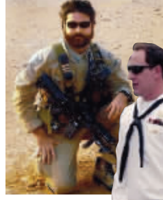
美国媒体报道的部分遇难人员照片