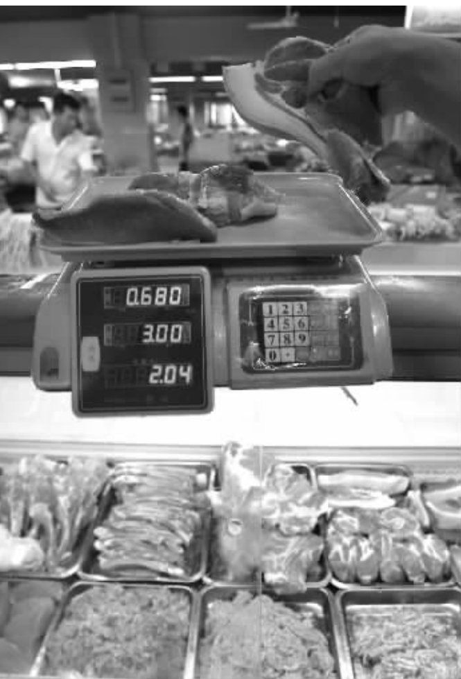
猪肉太贵了,不少市民买点肉要犹豫再三