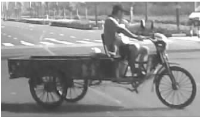
男子一手抱着婴儿一手驾驶三轮车

此事被网友“flashsee”于8月6日晚上7点39分发上网,迅速引起强烈反响,连日来,已有2.6万余人浏览,252名网友跟帖,被版主加亮标题,置于网站首页,成了论坛里最为火爆的帖