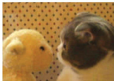
好巧啊,你也是圆头圆脸