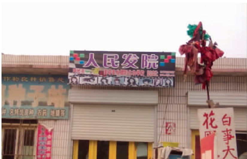
去这家理发让我感觉“鸭梨”很大