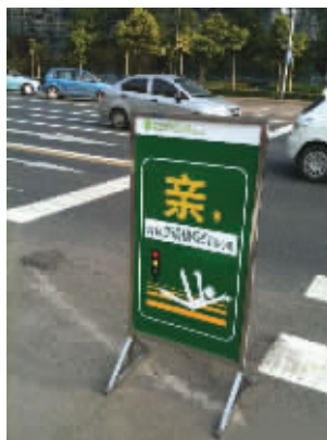
人类已经阻止不了淘宝体了