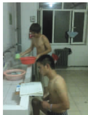
自习哥能把任何地方当教室