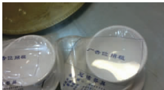
饭桌是一个寸土寸金的地方啊!