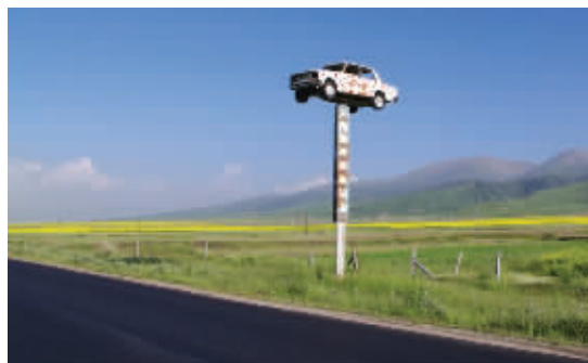
史上最惊悚的警示标志