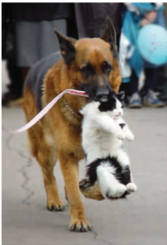
主人让我带你回去吃饭