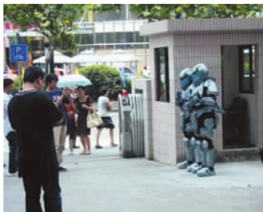
住在这个小区不用担心外星人入侵