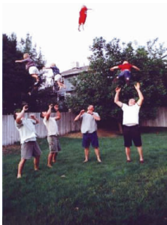
不能让男人带孩子,右二,你赢了