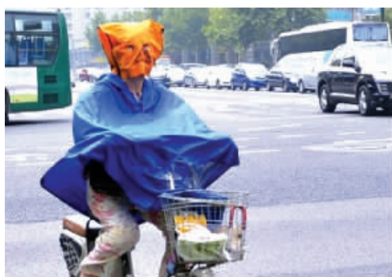
台风你带着暴雨来吧,我准备好了