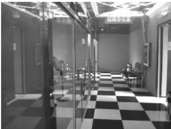
市场里空调仍打得很足,但大多数商铺都空空荡荡

尊铺广场地处城东苜蓿园大街华联超市南侧,经营服装、百货、鞋帽、餐饮。去年12月8日开业以来,这个大市场一直生意冷清,经营户从当初的100多户锐减到目前的20多户。昨天,勉强支撑的摊贩们集体向市场管理方申请退租,当初他们按每平米5元标准交了一年的租金,可是到后来,市场方招商时,租金却降到每平米2.5元,“这样太不公平”。