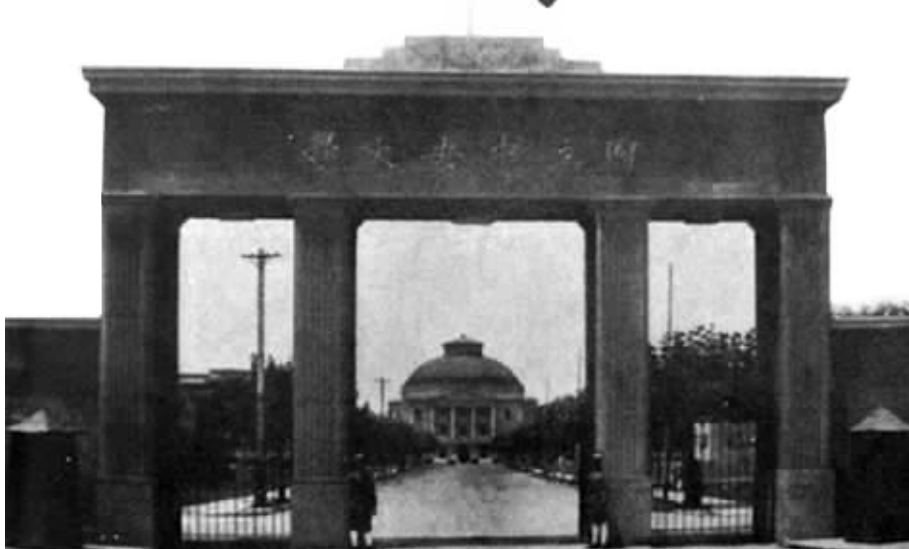
民国时期的中央大学,校门两侧站着全副武装的校警

京剧表演艺术大师梅兰芳逝世 1961年8月8日,中国著名京剧表演艺术大师梅兰芳逝世,享年67岁。他与尚小云、程砚秋、荀慧生一起被誉为京剧“四大名旦”。在唱、念、舞、扮各方面形成自己独特的风格,世称“梅派”。演出代表作有《宇宙锋》《贵妃醉酒》《霸王别姬》《断桥》《游园惊梦》《穆桂英挂帅》等。