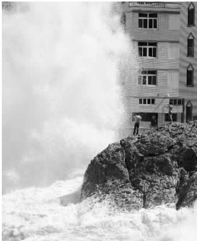
浙江省温岭市石塘镇居民在海边观巨浪