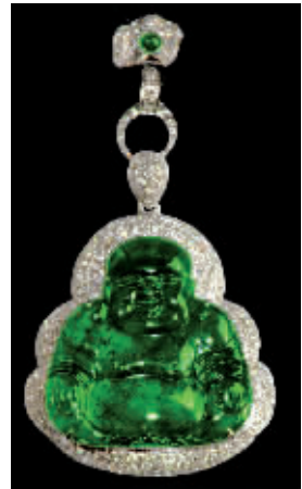
宝庆银楼 笑口弥勒佛