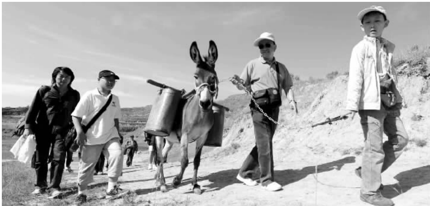
快报爱心读者赶着毛驴去为老乡运水