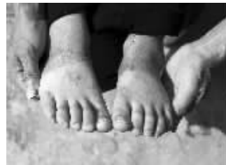
虎丁丁的脚已有伤疤和老茧