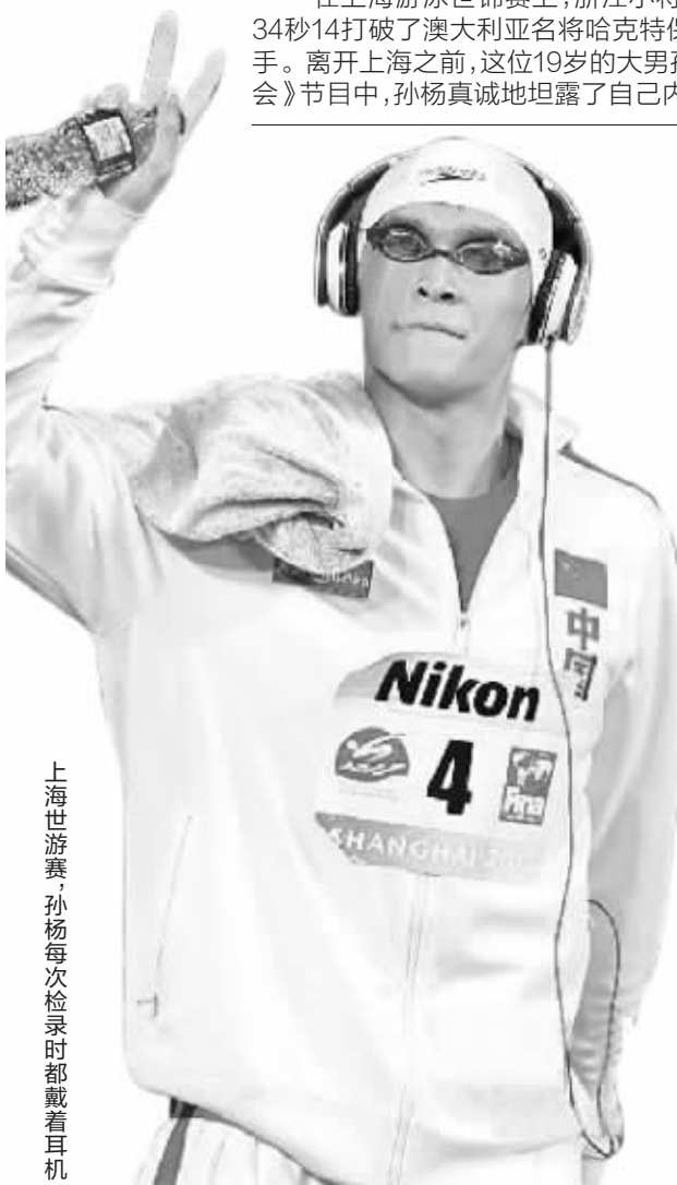
上海世游赛,孙杨每次检录时都戴着耳机

在上海游泳世锦赛上,浙江小将孙杨获得2金1银1铜的成绩,尤其是在1500米自由泳决赛中,孙杨以14分34秒14打破了澳大利亚名将哈克特保持了十年之久的世界纪录,并成为中国男泳首个拿到奥运项目冠军的选手。离开上海之前,这位19岁的大男孩接受了央视体育频道《风云会》主持人张斌的专访。在前晚播出的《风云会》节目中,孙杨真诚地坦露了自己内心深处的想法。