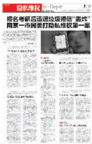
快报曾对案情做过详细报道

不公平?”他说,在随后准备考试中,自己被这些疯狂轰炸的垃圾信息搞得“崩溃”,与此同时,他得知不少报考这次研究生考试的同学、同事也有相同遭遇后,他担忧起公民隐私被泄露的问题。 去年10月底,他决定放弃这次考试的同时,也决定打一场隐私维权官司,于是,他将教育部学位与研究生教育中心和河海大学告上了法庭,而这也是自《侵权责任法》实施以来,在南京诉讼的公民隐私权第一案。