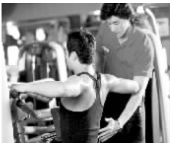
2011年“金吉鸟”杯南京健身健美比赛将于9月10日在山西路

青春剧场隆重举行。本次比赛由南京市健美操运动协会、南京金吉鸟健身中心、南京力士健身中心、南京力场健身中心共同举办。