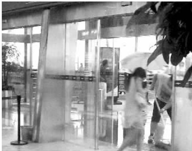
出发厅一号出口处,旅客撑伞从室内慌忙奔出

雨?记者就此致电黄花机场,工作人员解释,下午5点左右,机场T2航站楼出发厅确实出现了积水情况,但并非航站楼设计和施工质量所致。