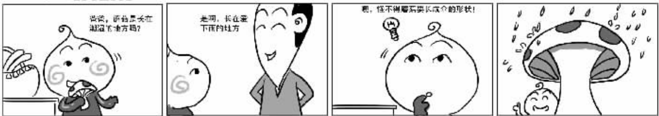
登录 http://b1207585.xici.net 提供更多素材 绘图:命脉科