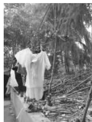
被砍的绿化树横七竖八倒在地上