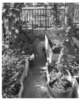
这样的“菜园”也得拆