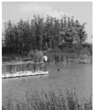
为了消暑,一些人无视禁泳警示牌冲进尚贤河游泳