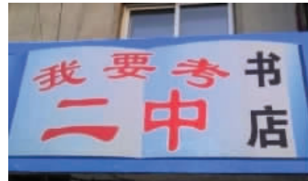
二中是个好学校啊!