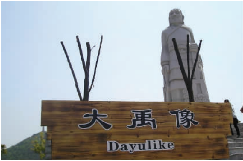
立了一个像,大禹很喜欢