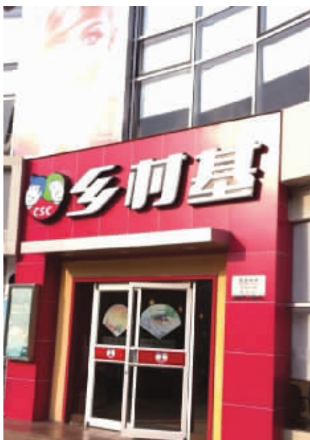
据说它还专门开在肯德基旁边