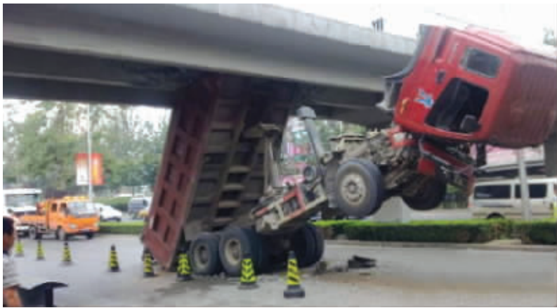
擎天柱,不能在桥底下变形啊