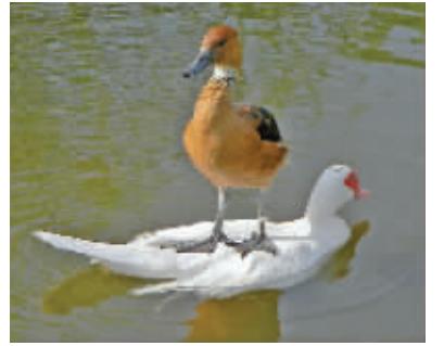
听说冲浪很好玩,试试