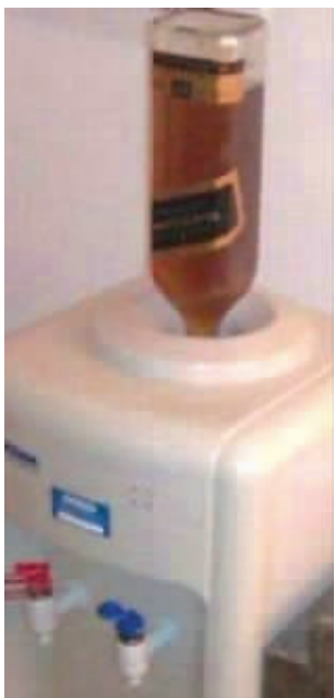
饮水机瞬间就霸气了啊