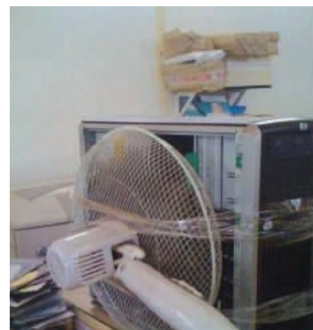
散热靠自己,才能不死机