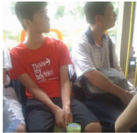
带英文的衣服千万别乱穿