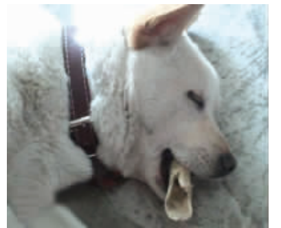
世界上最幸福的睡姿