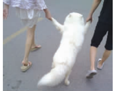
主人,爱我就放手吧!