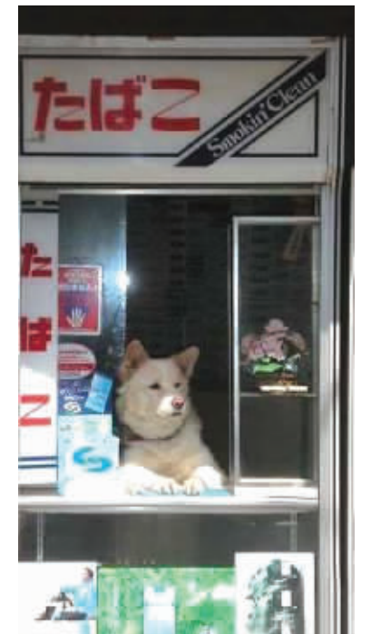
你好,请问需要点什么