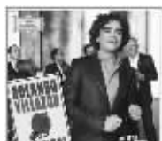
罗兰多·维拉宗 《我爱墨西哥》 推荐指数:★★★★★

继2010年《十年有巫》精选之后,时隔一年杨丞琳推出新专辑《仰望》。这次她挥别自出道以来就深受欢迎的“口爱教主”偶像包装,转型为充满自信感的实力派轻熟小女人。新专辑最大特色就是歌曲都很“难唱”,许多歌曲的音域很广,可以听见杨丞琳的成长与进步。