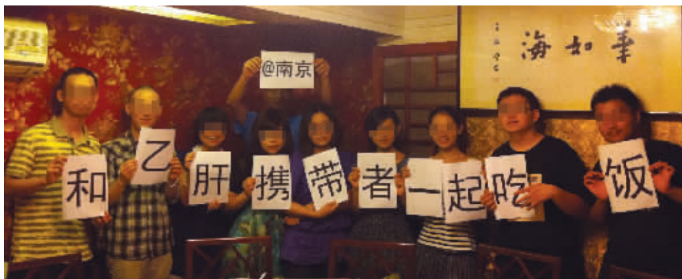
这次特殊的聚餐很有意义

在这场午餐开始之前，13名来自各行业的年轻人做了自我介绍，其中的几位乙肝病毒携带者也公开了自己的身份。这些人中有在校大学生，也有公司职员，还有正在做致力于消除乙肝歧视工作的志愿者。