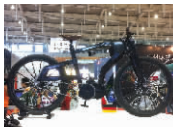
自行车价格堪比宝马