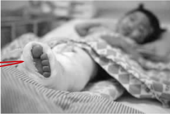
小伊伊能否保住左腿仍是未知数