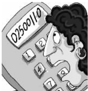
第1步 骗子冒充警察打来电话