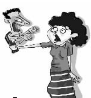
第2步 对被害人进行恫吓威胁