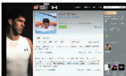
刚刚在新浪开通的微博