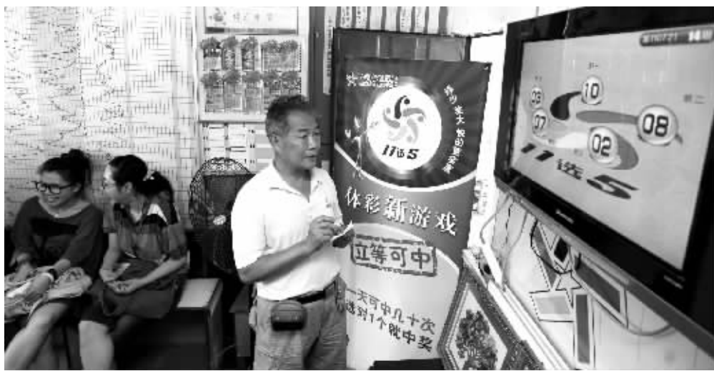
彩民正在等待开奖

7月22日,备受期待的全新体育彩票玩法“11选5”正式在我省上市,省内所有销售“11选5”的体彩站点在这一天个人气爆棚,“11选5”作为中国彩市快开游戏第一品牌的王者风范尽显无疑。