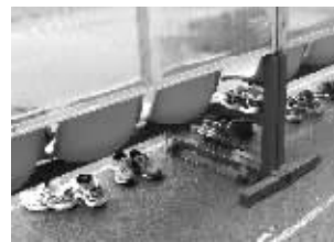
老挝队员的鞋子“五花八门”