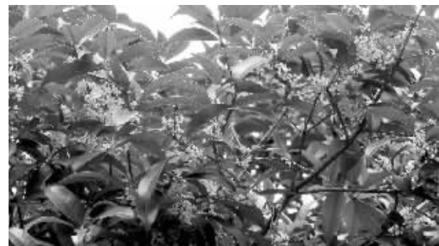
两株桂花耐不住性子提前绽放

快报才报道过海棠、玉兰等“春花夏开”,这不,秋天的花也来凑热闹了。“八月桂花香”,眼下才是农历六月下旬,南京林业大学的两株桂花竟然按捺不住性子,顶着三伏天的太阳就绽放了。