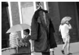
玄武门一电线杆上晒着阴潮的棉大衣

不过,晒“霉”也晒出了一些不和谐的“音符”。在鼎新路上,马路两侧机动车道护栏上也挂满了各种被褥。“大马路上,这么多床被子,不仅有碍观瞻,而且不安全。”过往的市民看了纷纷摇头。