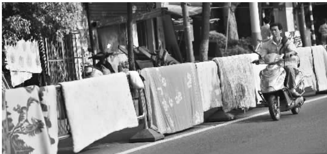
鼎新路的马路护栏上晒满了被子,“晒霉”虽好,能不能换个地方?

昨天,持续了38天的梅雨终于结束了,这是10年里最长的一个梅雨季。气象专家说,出梅后,全省暂时不会出现大范围的高温天气。而且出梅也不代表就不下雨了,24~26日,全省自北向南又有一次明显降水,要晾晒的市民得抓紧时间了。