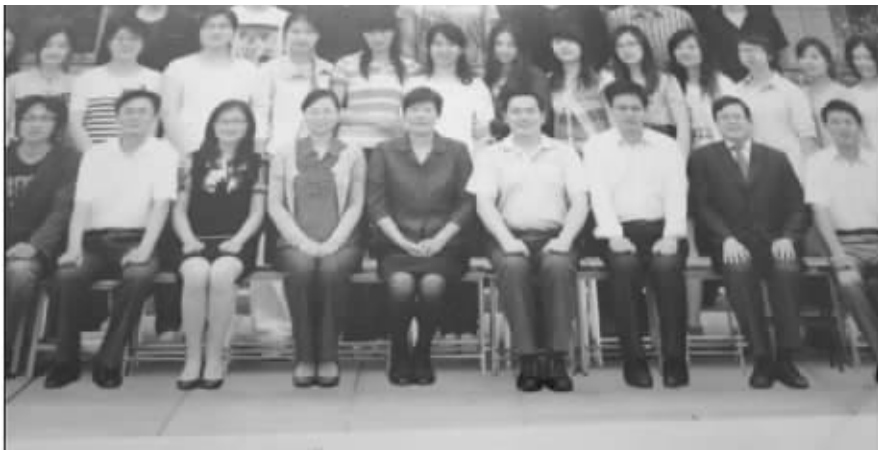
常州某高校教师“悬浮”毕业照