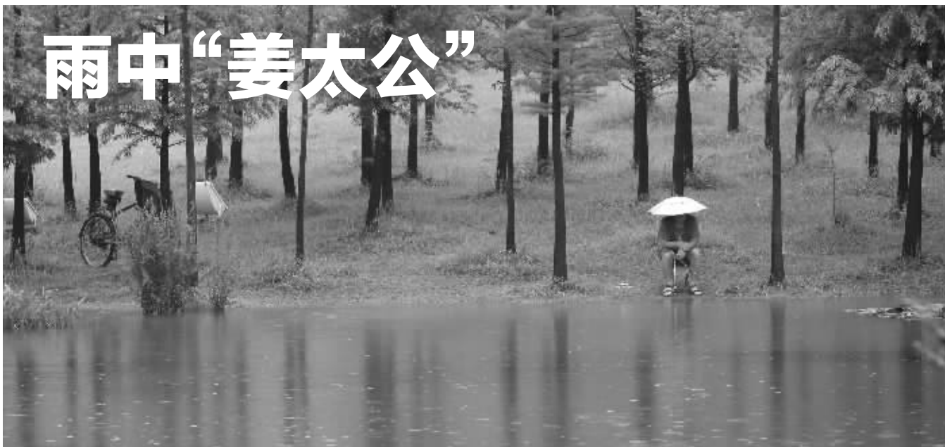
风吹、雨打、形单影只, 神马都是浮云, 挡不住一个人对钓鱼的追求。昨天, 中山门附近, 一名男子戴着帽子伞, 雨中独钓, 不禁让人联想起雨中“姜太公”。