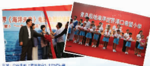
左图:公益毛毯《海洋天使》启动仪式 右图:青岛极地海洋世界青岛希望小学落成

在2006年底,青岛极地海洋世界创造了一个惊人的奇迹,在开业短短五个月的时间里创造了门票收入近亿元的业绩,为青岛乃至山东省赢得了巨大的经济利益。同时,青岛极地海洋世界的迅速崛起,带动了以极地馆为核心的,周边地区服务业市场的发展,使之成为新的旅游经济的增长点。青岛极地海洋世界也由此成为青岛旅游的金牌项目。