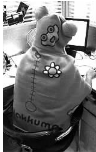
炎炎夏日,网友将自己裹得严严实实

不哭不哭:我们办公室就像冰窖一样,冻得要命,我们一律长裤长衣,另外我还要加一件毛衣外套。有同事就说,我们都会永远年轻,因为我们生活在冰库里,保鲜啊。 综合