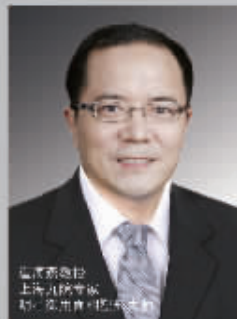
副主任医师 上海九院专家 南医大二附院特聘专家