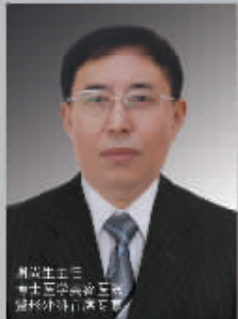
副主任医师 南医大二附院专家 微创注射美容专家