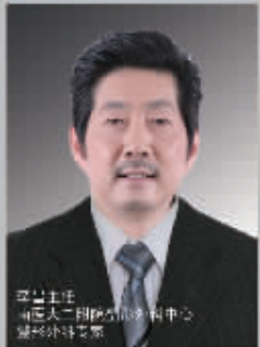
副主任医师 南医大二附院整形美容中心 微创注射专家