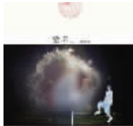
卢凯彤 《掀起》 评分:★★★★☆

卢凯彤以创作见长,如果要选现时香港最有才华的女唱作人,除了卢巧音、王菀之,下一位数到的应该就是卢凯彤。首张大碟很能取悦当下文青,听得到的朴实中显踏实,捕捉了一些属于青春的霎时冲动,唱出了青涩之爱的碎念物语。