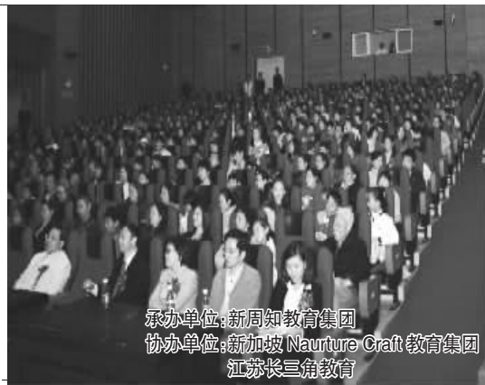
承办单位:新周知教育集团 协办单位:新加坡Naurture Craft教育集团 江苏长三角教育

领票点: ●中山北路95号江苏议事园大厦19楼1915室 ●新街口大众书局二楼好记星专柜 ●新街口新华书店二楼好记星专柜