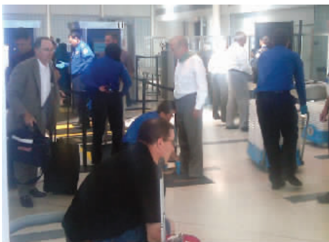
拉姆斯菲尔德(图中穿白衣者)接受安检