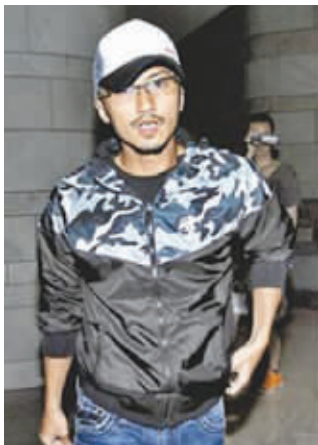
霆锋一如既往地镇定