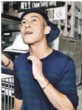
冠希下意识抬头张望

闹得沸沸扬扬的锋芝离婚事件13日出现令人咋舌的一幕。当天,众香港记者正在中环追踪理发的谢霆锋,事件中的另一关键人物,霆锋的“情敌”陈冠希竟突然出现,见大批媒体守候,他还好奇地问大家在等谁。一众记者笑着回他:“等你的老朋友!”在知道是谢霆锋后,陈冠希一边尴尬地微笑,一边加快脚步闻“锋”而逃。