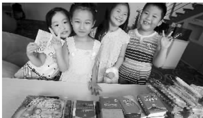
四名小朋友捐来了很多文具和书