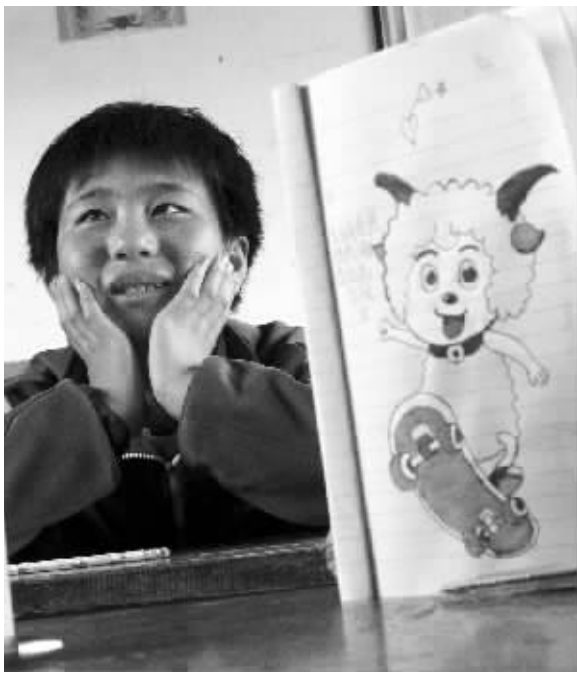
小岔乡学校的慧睿特别喜欢画画

中午11点半下课了，快报记者留了两个馍馍给他。虎丁丁说不饿。但他用干净的纸巾包好，说留给奶奶吃。