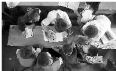
支教团队给孩子们上课