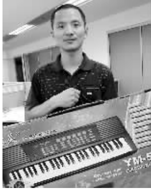
许多南京市民捐来电子琴，小白雪的愿望就要实现了