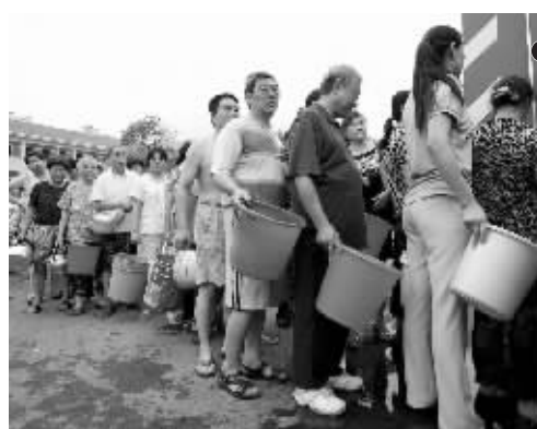
昨日,银龙花园三期居民排队取水