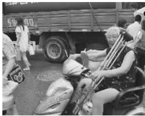
银龙花园四期一位八旬老人开着残疾车冒雨取水