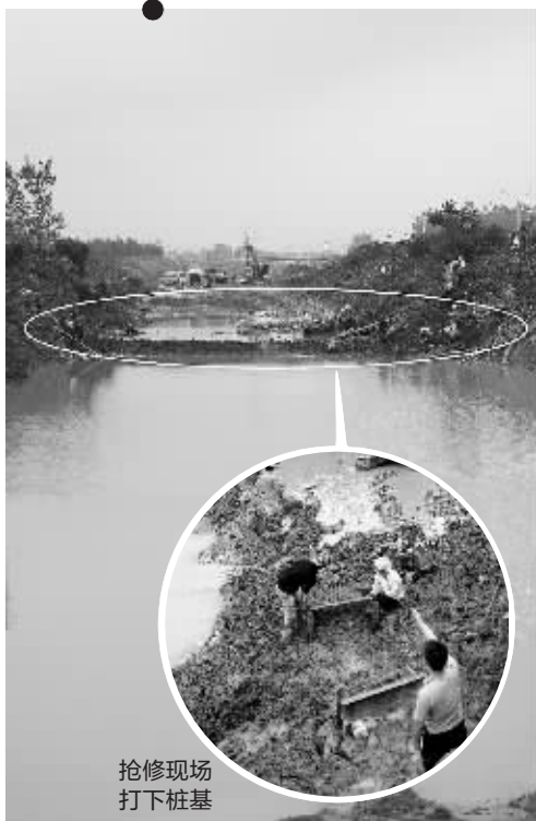
水管爆裂,工地基坑一片汪洋