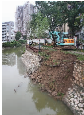
金川河瓜圃桥北侧塌方

记者从南京市综合整治指挥部了解到,将对内金川河沿线的河道护坡挡墙进行全面体检,长度约在7公里左右。