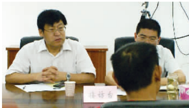
环保局长在听市民反映问题